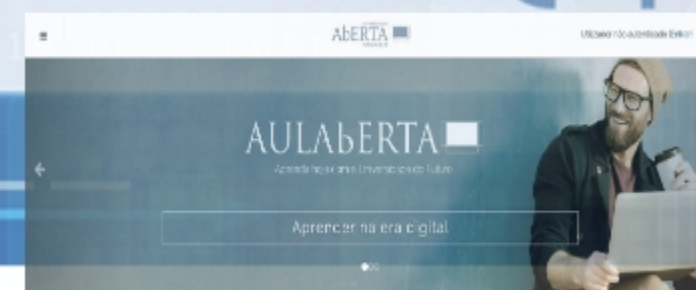
AULA ABERTA | Aprenda gratuitamente online com a Universidade Aberta Plataforma Aula Aberta