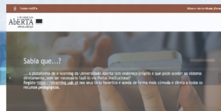
Plataforma eLearning UAb