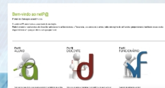
Portal Académico UAb